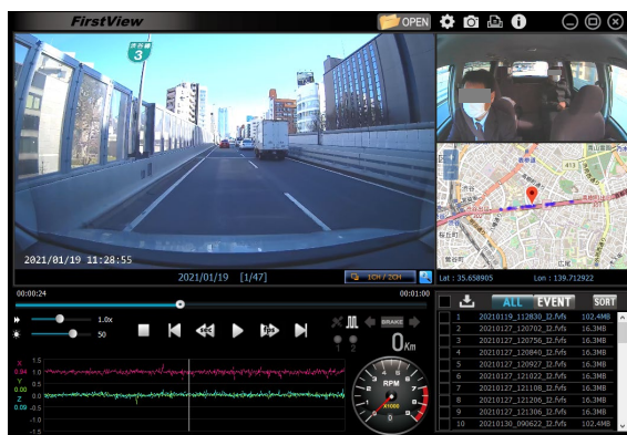
専用ビューワーソフト