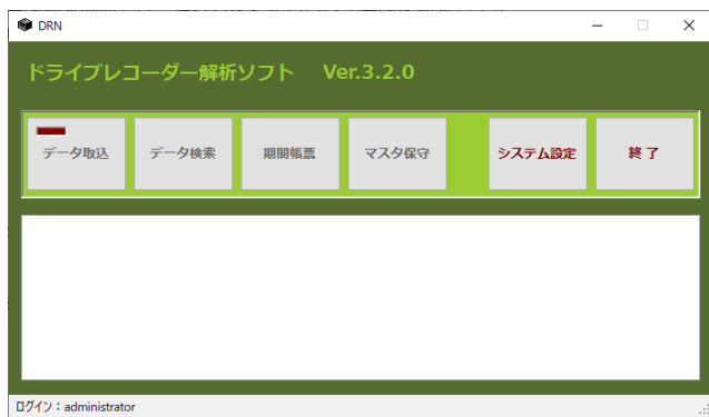
日報軌跡ソフトメニュー画面