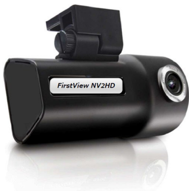
ドライブレコーダー FirstView NV2HD