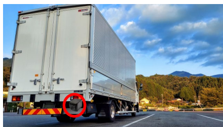
大型トラック（イメージ）