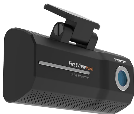
ドライブレコーダー FirstView V3HD