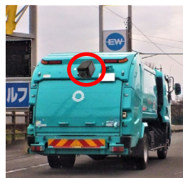
パッカー車設置（イメージ）